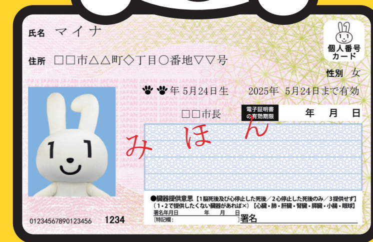
マイナンバーPRキャラクター マイナちゃん