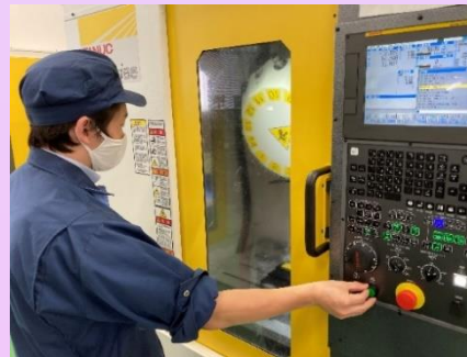
数値制御機器を自身の手足のように駆使して、設計アイデアを具現化する