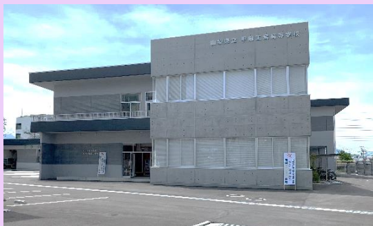
2020年4月 第1期生が入学した新築校舎