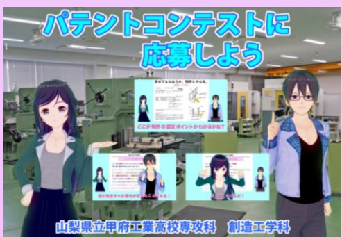
工業系高校生向けに教材映像を制作