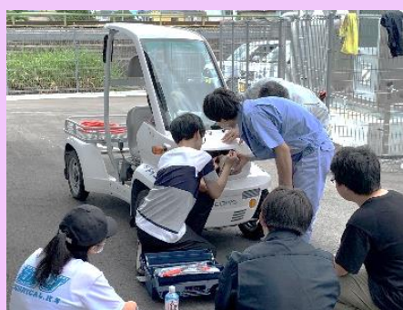
課外活動ではソーラーカーのレーシングチームが発足