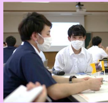
社会人より人生観についてお話を頂き人間性を磨く