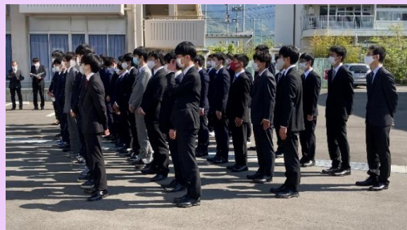
2021年4月 第2期生を迎え学年が完成