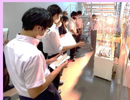
山梨大学燃料電池ナノ材料研究センターを見学し、水素社会を考える