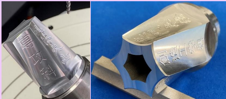
新たに身に付けた技術により生み出される珠玉の名品の数々