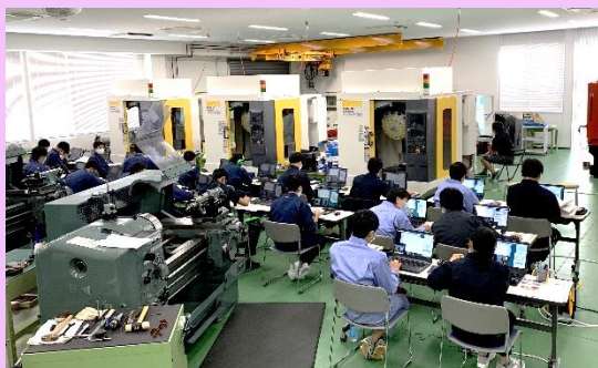
ファナック㈱と実習室をネットで繋ぎ、切削加工機「ロボドリル」のオンライン研修