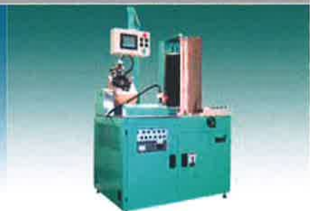
■ウェルジー7 (自動 TIG 溶接機)

レーザ・タレパン複合機 レーザ切断機 タレットパンチプレス ガントリー穴加工機 NCプレスブレーキ シャーリング 自動 TIG 溶接機