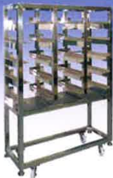
ステンレス研磨収納ラック