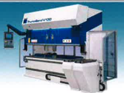
■トルンプバンダー (TruBend V130) 加圧能力 1300KN 曲げ長さ 3060mm