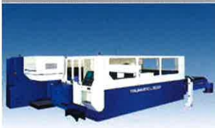
■トルンプ レーザ切断機 出力 3KW 加工範囲 1500*3000 / SUS クリーンカット t12 / SS t20