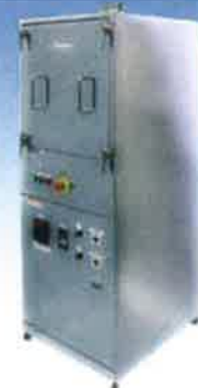
ステンレス研磨ケース