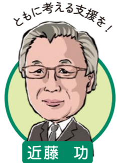
ともに考える支援を！